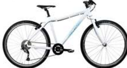
TWENTYSIX LARGE ●