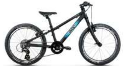
TWENTY LARGE ● ●