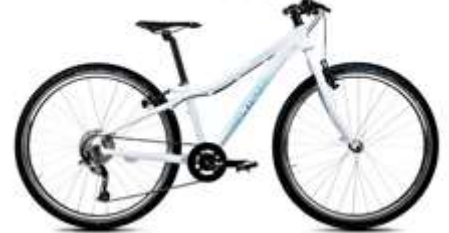
TWENTYSIX SMALL ●