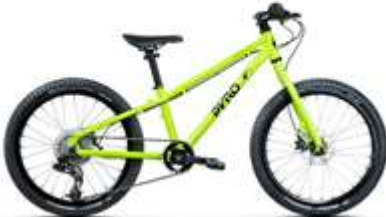
TWENTY ULTRALIGHT ●