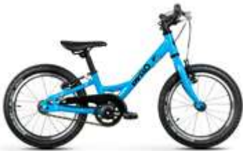
SIXTEEN ● ●

Wir von PYRO legen grossen Wert auf geringes Gewicht unserer Velos und eine perfekte Anatomie für die Kinder. Durch eine intelligente Auswahl von hochwertigen Rahmen und Komponenten erreichen wir ein kindergerechtes Gewicht. Trotzdem zeichnet sich ein PYRO durch seine Langlebigkeit und Nachhaltigkeit aus. Die fein abgestuften Größen erlauben dem Kind ein ergonomisches Fahren mit weniger Kraftaufwand. Ein PYRO steigert die Freude und Motivation bei den Kindern. Die coole und zeitlose Optik wird abgerundet durch die zuverlässige Technik.