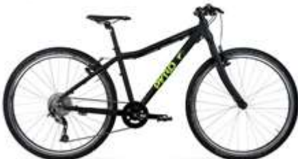
TWENTYSIX MEDIUM ●