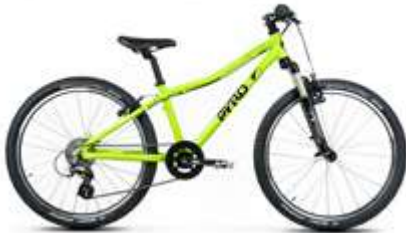
TWENTYFOUR LARGE SUSP. ● ●