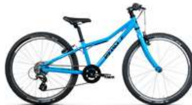
TWENTYFOUR SMALL ● ●