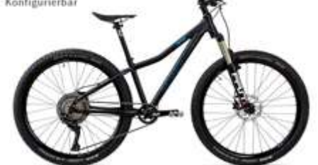
X.13 ● Konfigurierbar