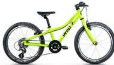
TWENTY SMALL ● ●