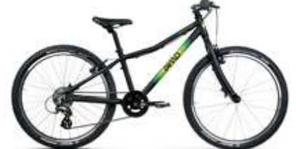
TWENTYFOUR LARGE ● ●